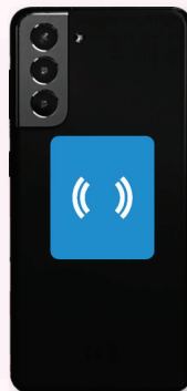
Galaxy S7 Edge, S8, S8+, S9, S10, S20, S21