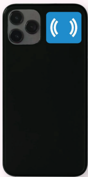
iPhone X, XS, XS Max, XR, 11, 11 Pro Max, Pro, SE, 12